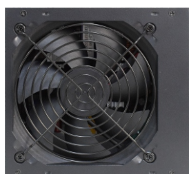
Ventilação de 120x120mm