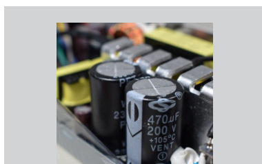
Filtro de entrada