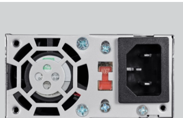
Ventilação de 40x40mm