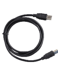
Cabo USB 1300mm