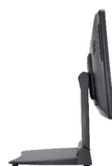
suporte com amplo ângulo de inclinação