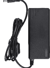
Fonte de alimentação 12V DC 2,6A 1000mm