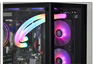
WATER COOLER INSTALADO