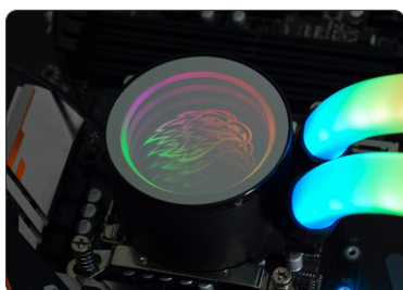
BOMBA FIXADA EM PLACA-MÃE