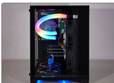
RADIADOR FIXADO EM GABINETE