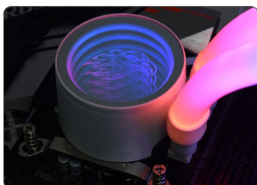
BOMBA FIXADA EM PLACA-MÃE