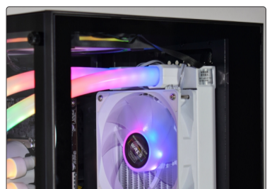
WATER COOLER INSTALADO