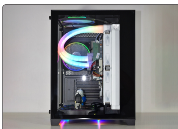
RADIADOR FIXADO EM GABINETE