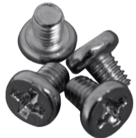
PARAFUSOS DE FIXAÇÃO (BOMBA)