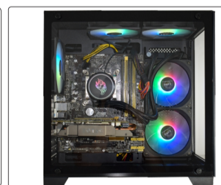
WATER COOLER INSTALADO