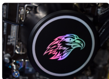
BOMBA FIXADA EM PLACA-MÃE