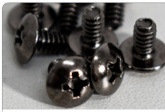
PARAFUSOS DE FIXAÇÃO (RADIADOR)