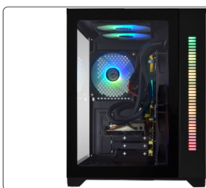
RADIADOR FIXADO EM GABINETE