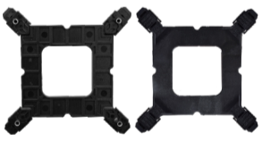
01 BASE RETANGULAR