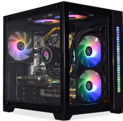
WATER COOLER INSTALADO NO GABINETE