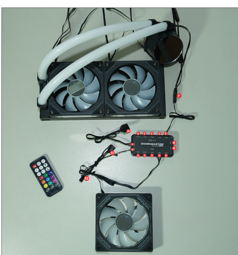
DIAGRAMA DE CONEXÕES