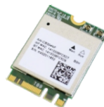
Placa WiFi (opcional)