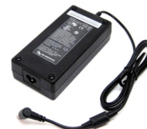
Plug 5,5mm externo (-) 2,5mm interno (+)