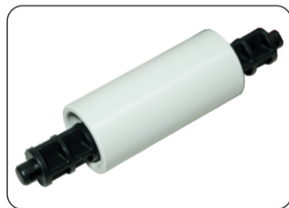
SUPORTE PARA BOBINA