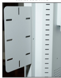
SUPORTE PARA FIXAR MÁQUINA DE CARTÃO