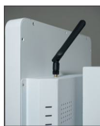
ANTENA WIFI EXTERNA