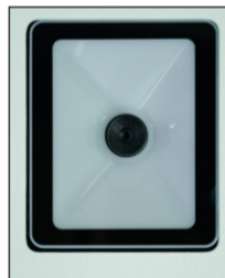
LEITOR DE QR CODE E CÓDIGO DE BARRAS