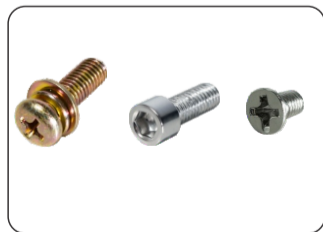
PARAFUSOS PARA FIXAÇÃO