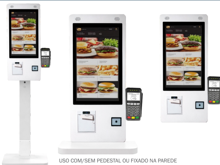
USO COM/SEM PEDESTAL OU FIXADO NA PAREDE